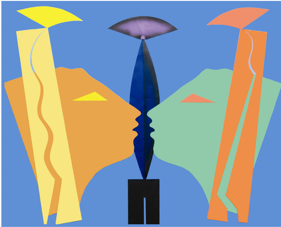
SCULTURE collage-carta su tela cm 100 x 80