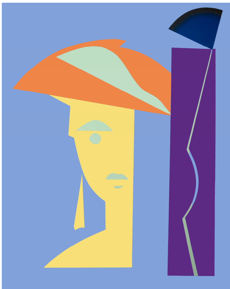
FRONNA 2 collage-carta su tela cm 100 x 80