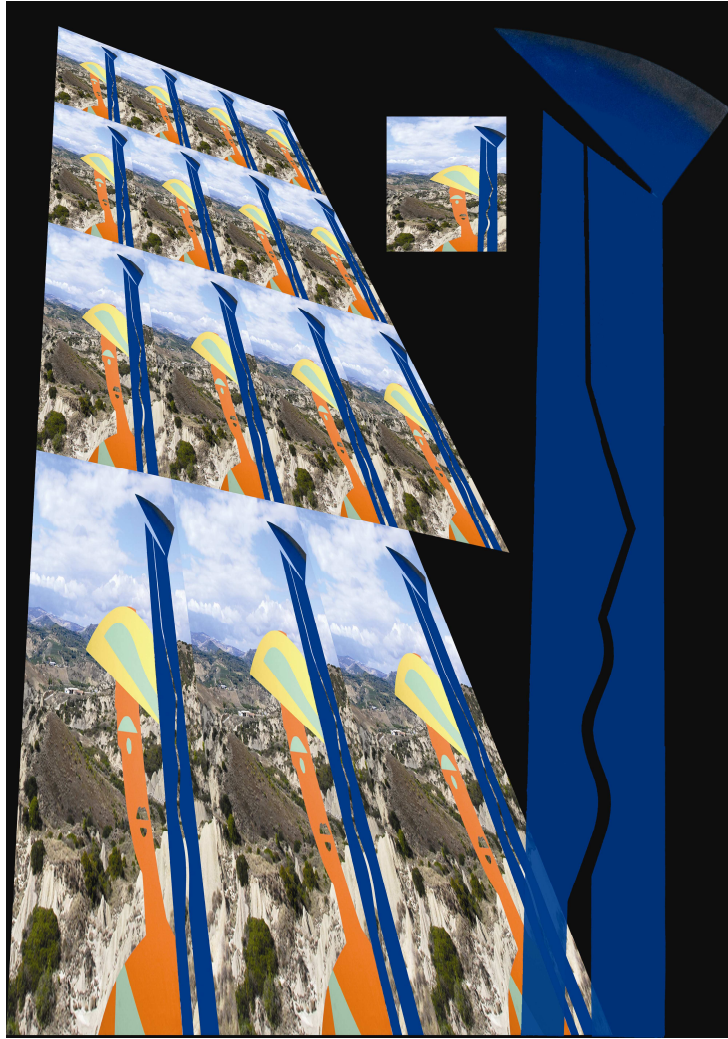
FRONNA Formato renderiNg cm 40 x 50