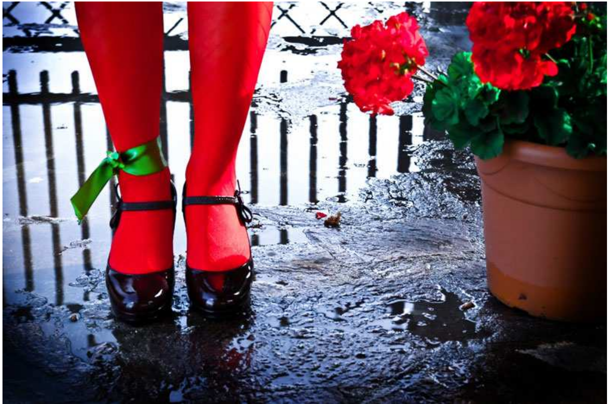
Carmen Laurino INTERPELLAZIONI Stampa fotografica su forex cm 40 x 60 2008