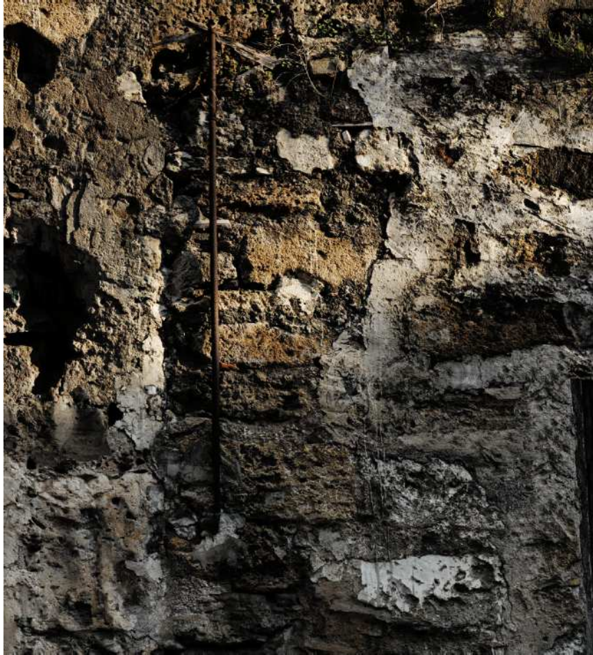
SITE SPECIFIC - TROMPE L'OEIL pala d'altare assemblata digitalmente, stampa CMYK su pvc cm 165 x 70 2009