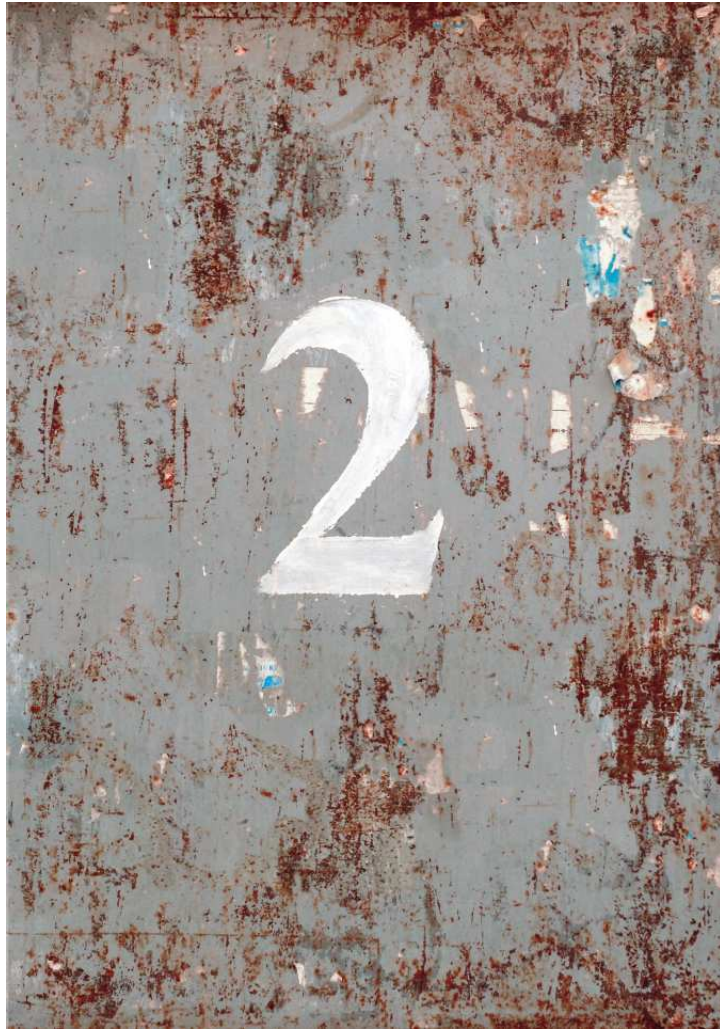
2 poster per affissione in esterni, stampa CMYK su carta cm 100 x 70 2009