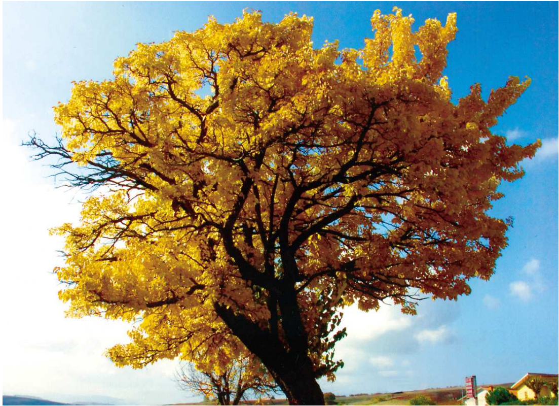
SUGGERIMENTI FOTOGRAFICI "SULLA VITA INDOSSATA AL CONTRARIO" N. 2 Foto digitale stampata su carta Brillant Kodak cm 40 x 30 2008