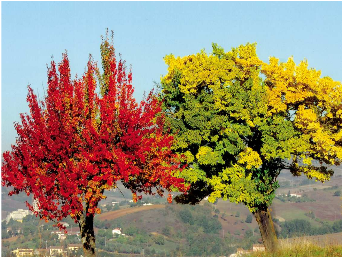
SUGGERIMENTI FOTOGRAFICHE "SULLA VITA INDOSSATA AL CONTRARIO" N. 6 Foto digitale stampata su carta Brillant Kodak cm 40 x 30 2008