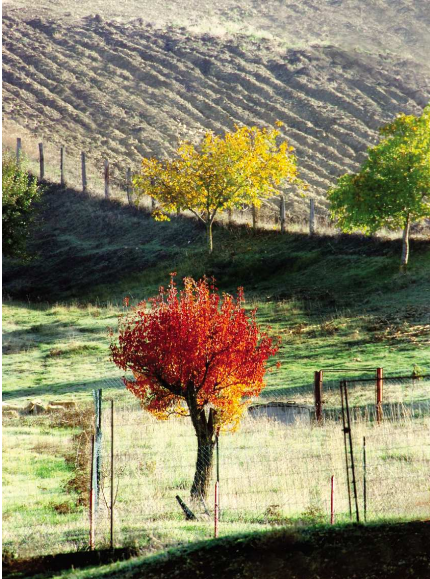
SUGGERIMENTI FOTOGRAFICI "SULLA VITA INDOSSATA AL CONTRARIO" N. 3 Foto digitale stampata su carta Brillant Kodak cm 40 x 30 2008