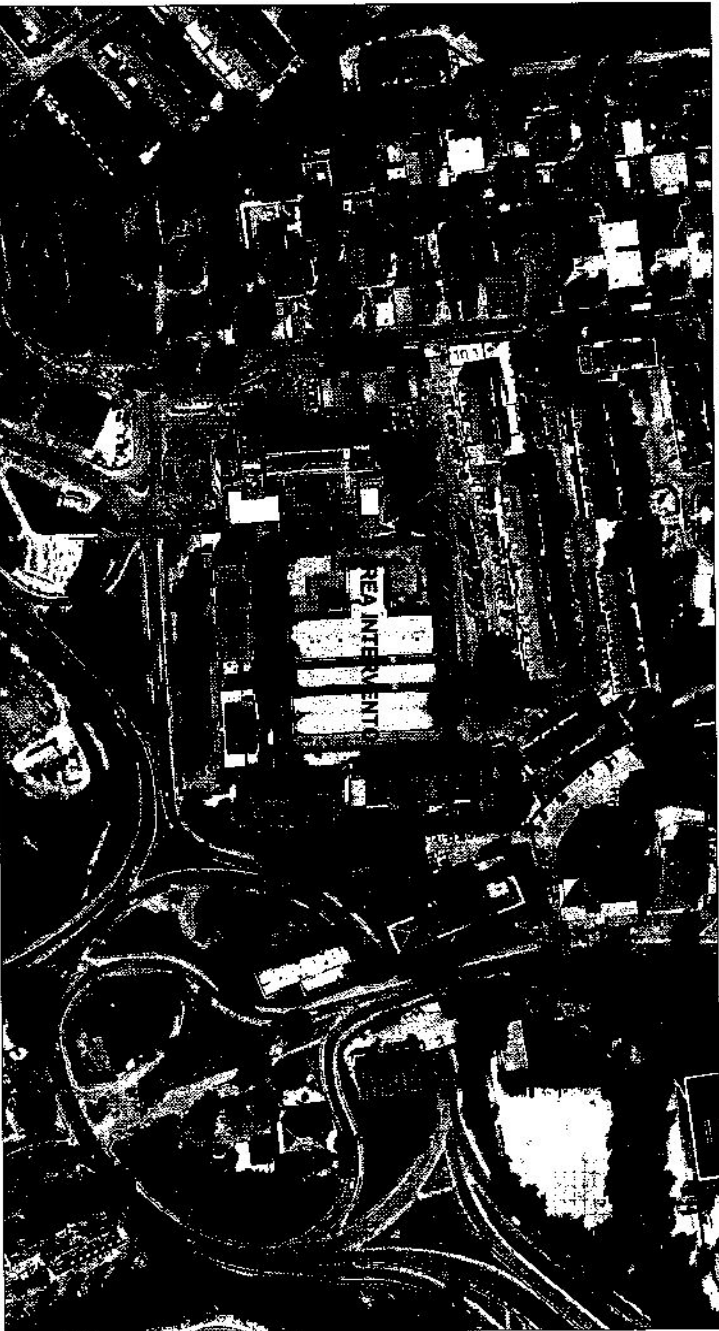
2. PIANI AEREO-FOTOGRAFOMETRICA (FOTO SCALA 1:1000)

LEGENDA → PIANO DI INTERVENTO IN ALZATO --- LINEE IN BIANCO PER IL TRACCIAMENTO DEI PERIMETRI E DELLE VIE DI CIRCOLAZIONE E DEI PERIMETRI DI INTERFERENZA --- LINEE IN GRIGIO PER IL TRACCIAMENTO ■ AREA INTERESSATA ALLA SOSTA VEICOLI IN ATTESA PER IL TRACCIAMENTO ■ AREA INTERESSATA ALLA SOSTA VEICOLI IN ATTESA PER IL TRACCIAMENTO ■ AREA INTERESSATA ALLA SOSTA VEICOLI IN ATTESA PER IL TRACCIAMENTO ■ AREA INTERESSATA ALLA SOSTA VEICOLI IN ATTESA PER IL TRACCIAMENTO ■ AREA INTERESSATA ALLA SOSTA VEICOLI IN ATTESA PER IL TRACCIAMENTO