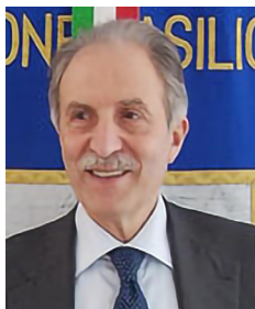
Vito Bardi Presidente Regione Basilicata

È con grande gioia e orgoglio che saluto la grande famiglia di Special Olympics che ha deciso di individuare nelle città di Potenza e Pignola le sedi dei Play the Games 2023 di atletica, bocce, equitazione e hockey in programma dal 19 al 21 Maggio prossimi. Un