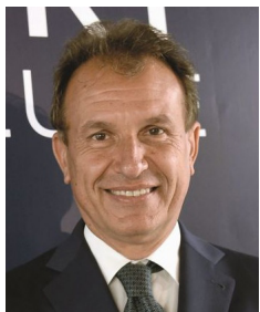
Vito Cozzoli Presidente di Sport e Salute

Nell'anno dei mondiali di Berlino previsti per il prossimo giugno i consueti giochi nazionali estivi si trasformano nei Play the Games 2023, un lungo appuntamento che accompagnerà atleti e familiari di Special Olympics Italia. I Play the Games rappresentano un'esperienza unica, una grande emozione ed evidenziano in modo sempre più incisivo come lo sport sia soprattutto lo strumento di inclusione sociale per eccellenza in grado di abbattere ogni tipo di barriera. Tanti eventi che incarnano e rafforzano lo spirito e i valori del "Play Unified", campagna di comunicazione lanciata a livello mondiale dagli Special Olympics che pone l'accento sul gioco unificato e sull'importanza della condivisione di una passione comune