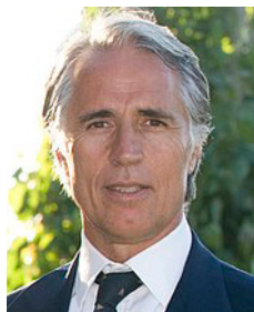
Giovanni Malagò Presidente CONI

Un Movimento che attraverso lo sport e i suoi valori, ha favorito la promozione dell'inclusione, della solidarietà e dell'integrazione. I vostri progetti e le attività sportive, condite da un entusiasmo inesauribile, testimoniato dal rapporto tra atleti con e senza disabilità intellettive sono da sempre un punto di riferimento per il sistema sportivo. Per i traguardi, le vittorie e le gioie raggiunte, ma soprattutto per le storie che si celano dietro ogni medaglia o competizione. E questa è la vera essenza dello sport. E voi ne siete l'esempio. In bocca al lupo per il futuro."